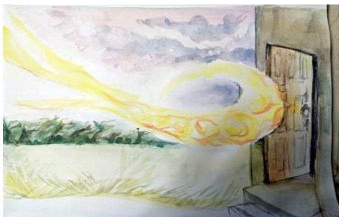
„Letnice“ od Natachy Vernyovej

Určite stojí za to pripomenúť si, čo sa stalo na prvé Letnice, kedy žila malá skupina 120 veriacich v neistote a ohrození.